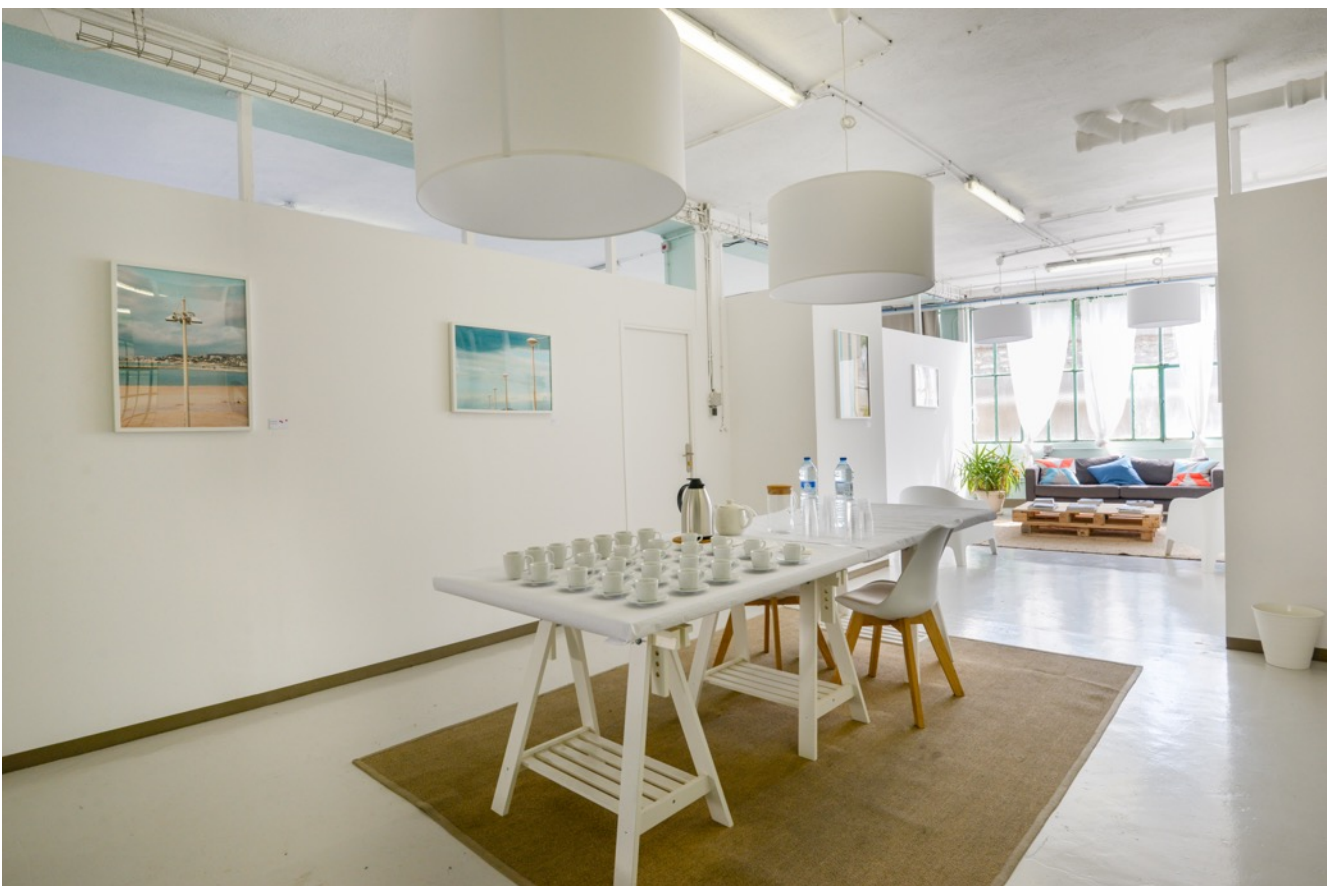
Espace de réception