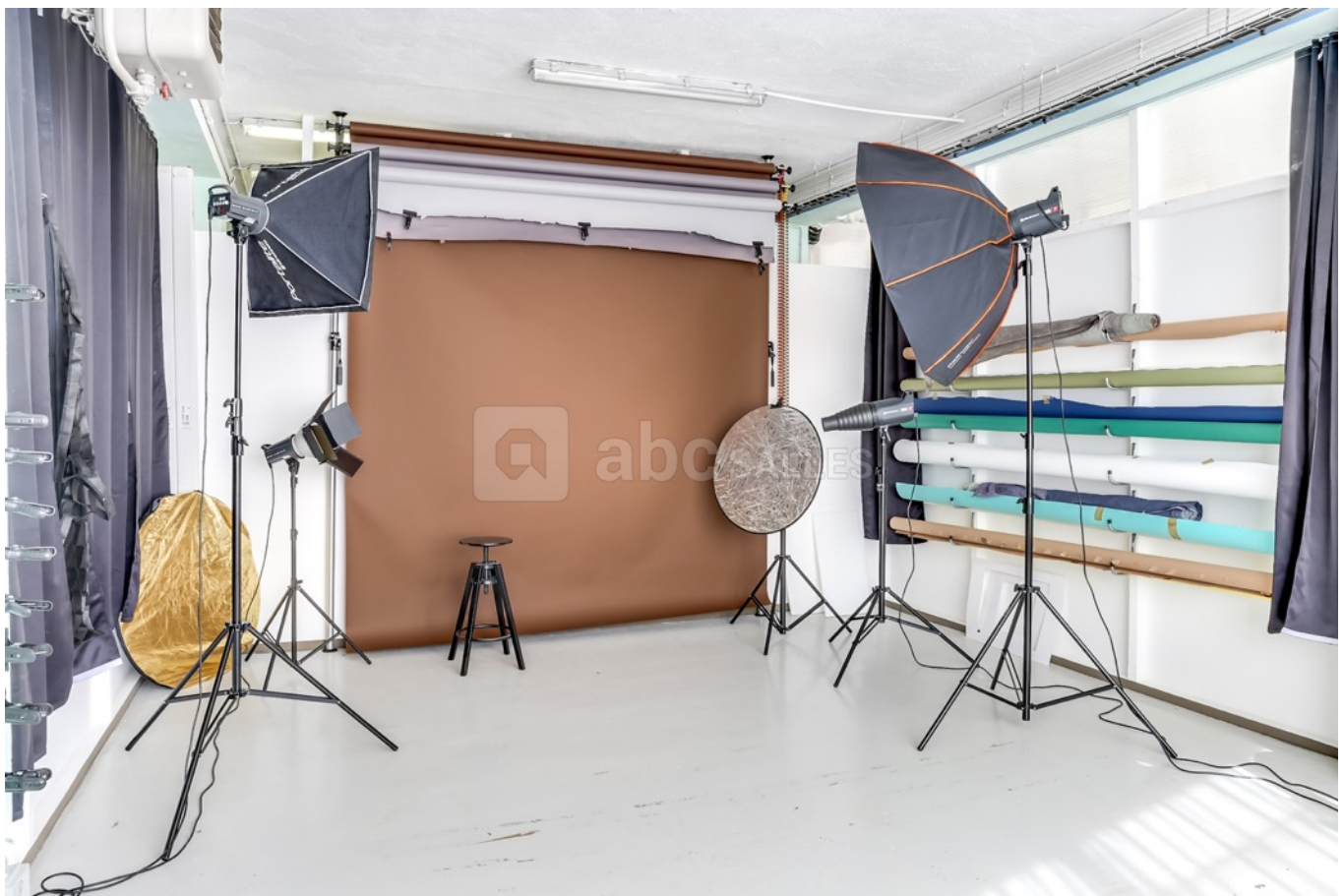
Studio Photo équipé de 25m2