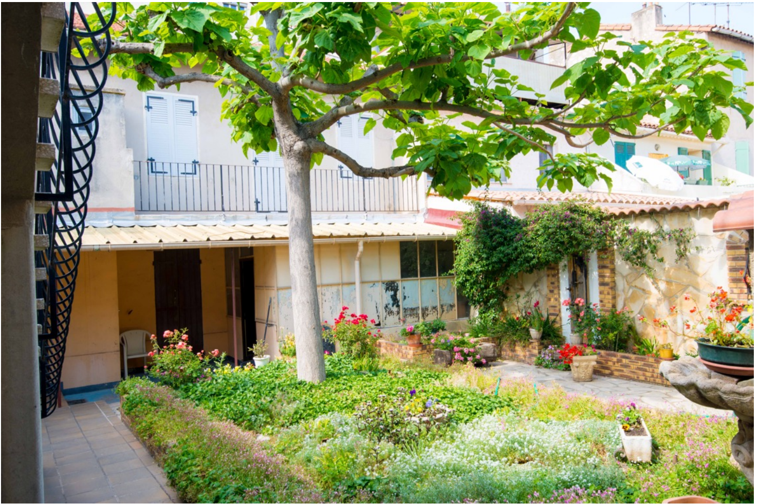
Cours 2 / Jardin