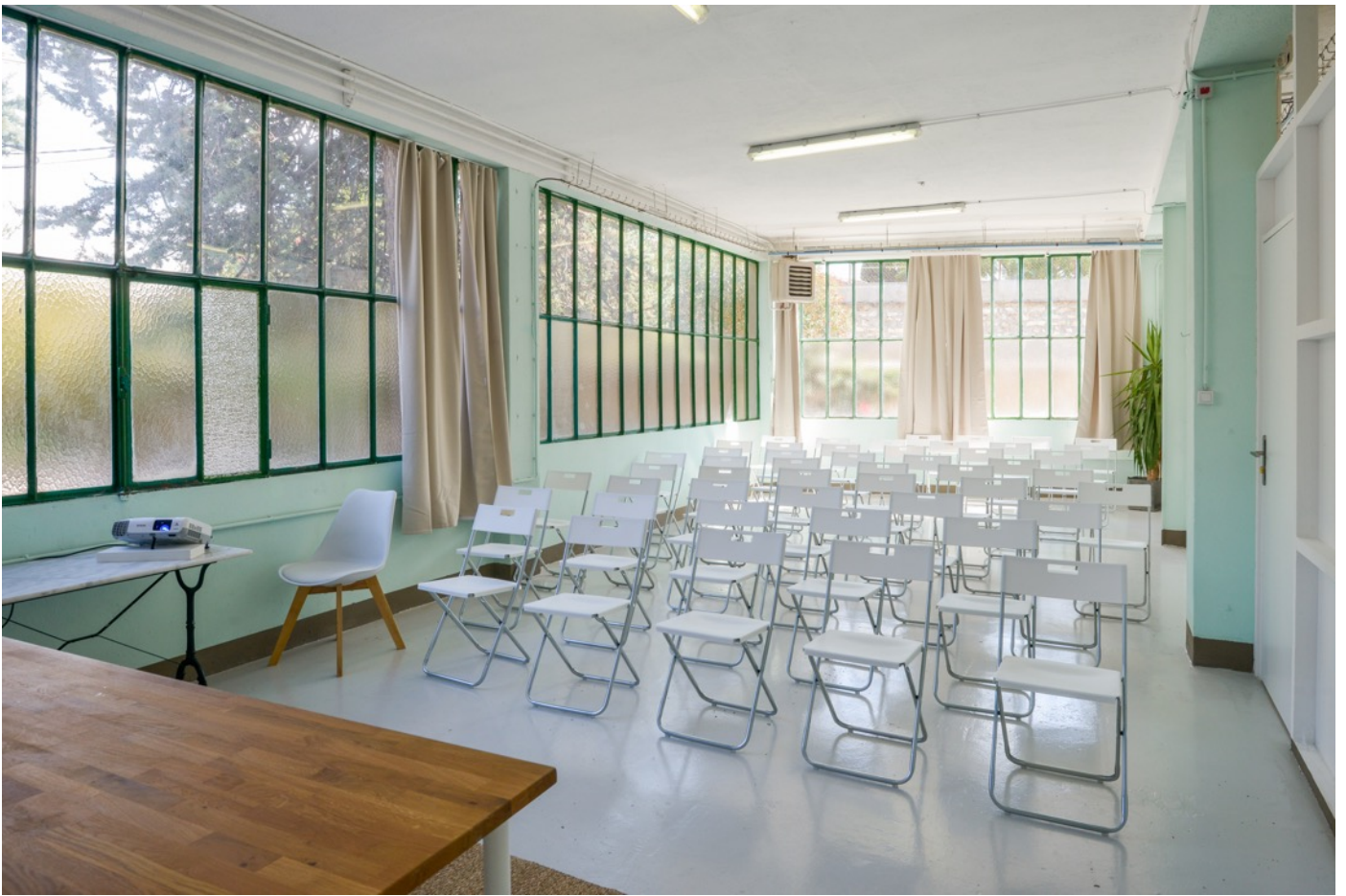
La Salle Conférence (45m2)