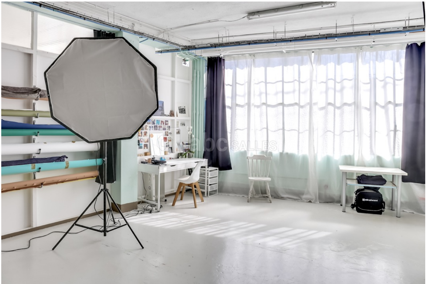
Studio Photo équipé de 25m2