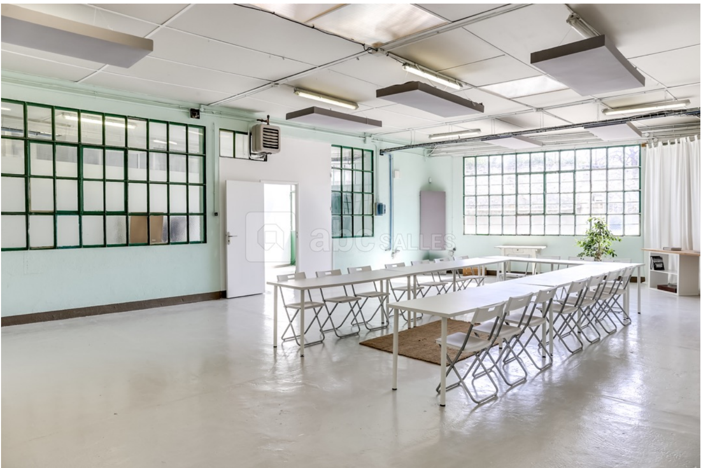
La Salle Atelier (100 m2)