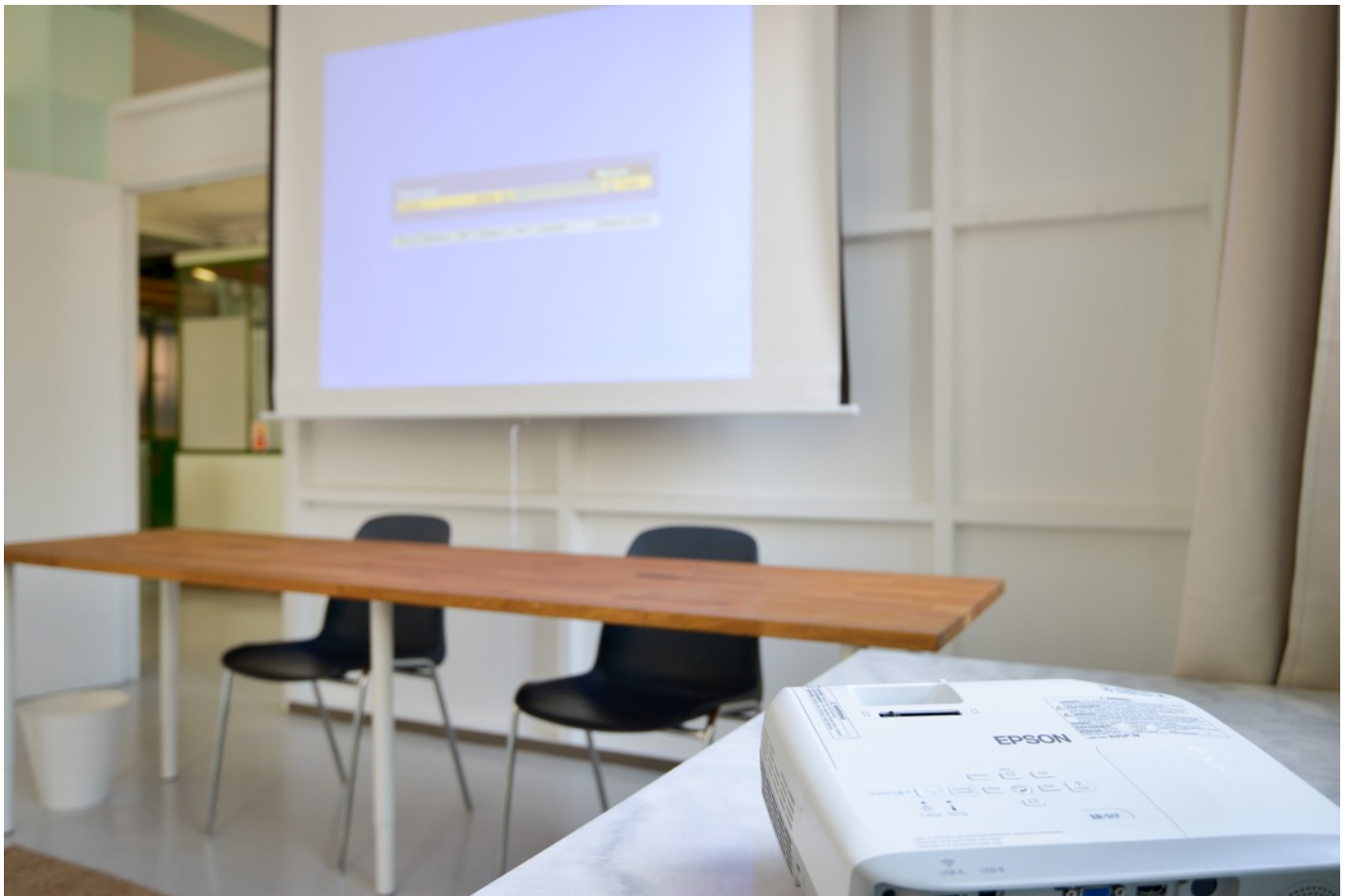
Vidéo Projecteur HD