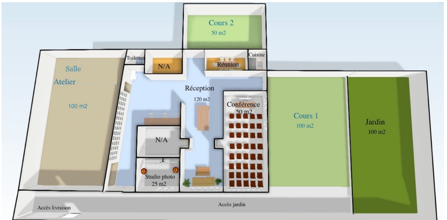
Plan de sol