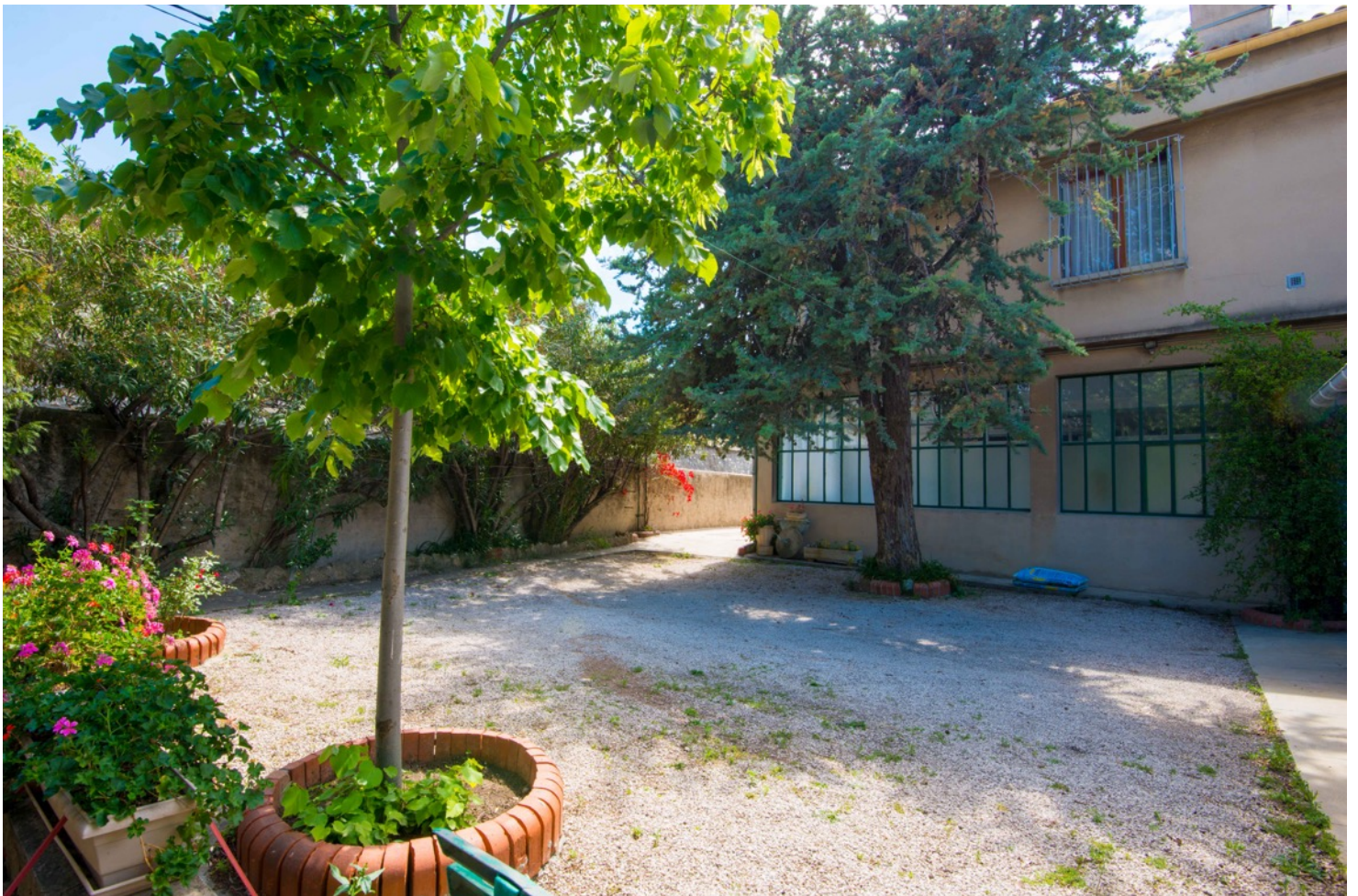
Cours 1 / Jardin