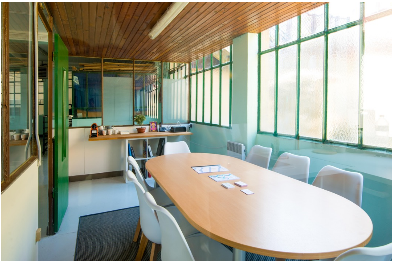
Salle de réunion