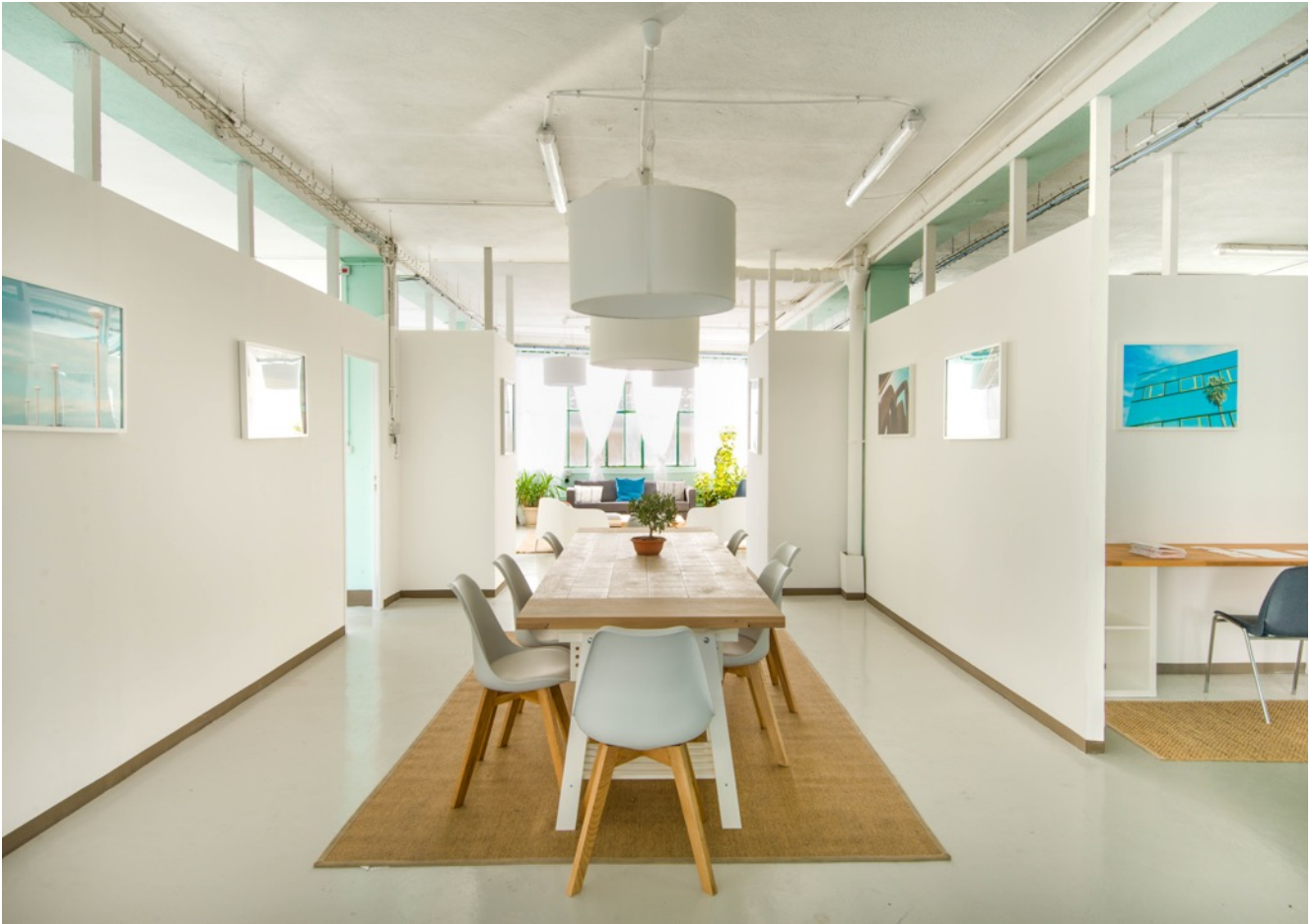
Espace de réception