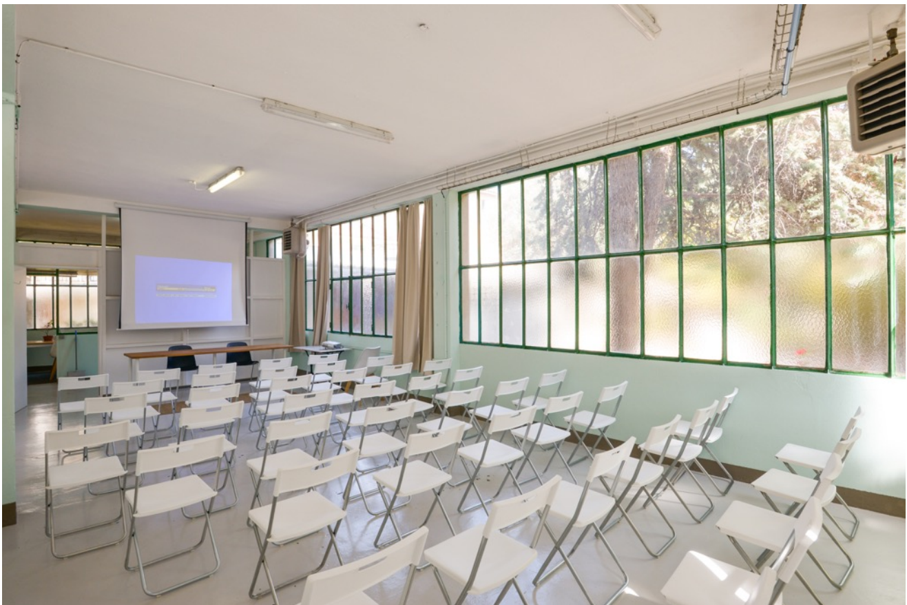
La Salle Conférence (45m2)